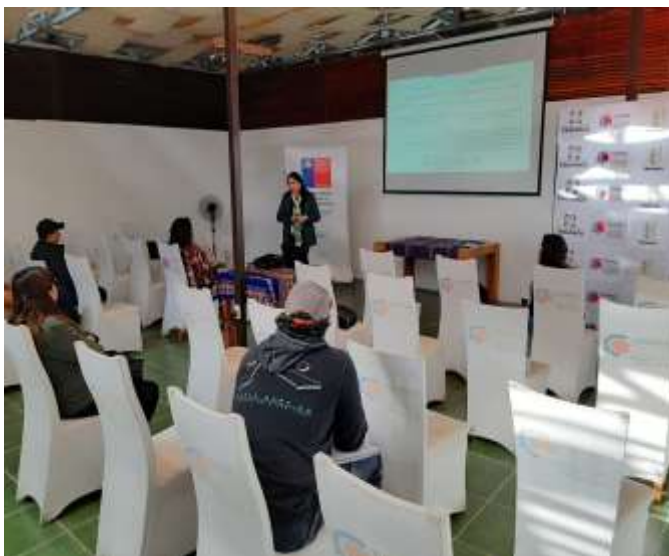
Taller Superintendencia de insolvencia y reemprendimiento, 13 de agosto del 2024

https://www.superir.gob.cl/usuarios-sercotec-tarapaca-alternativas-legales-para-personas-y-empresas-sobreendeudadas/