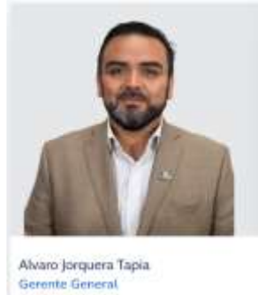
Figura Nº 2: Gerente General CRDT, periodo 3 er trimestre 2024.