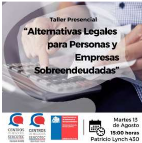
Flyer de difusión, taller dictado por la Superintendencia de insolvencia y reemprendimiento

Otra capacitación a destacar, corresponde a una sobre la relación laboral de empresas con inmigrantes, la cual se gestionó gracias al trabajo colaborativo entre la Corporación y el Servicio Nacional de Inmigraciones, la cual generó un impacto positivo a las pymes de la ciudad de Iquique.