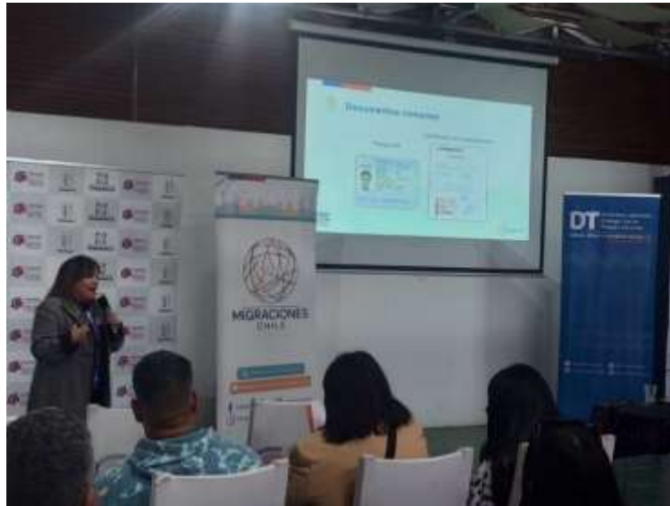
Taller Servicio Nacional de Inmigraciones, día 29 de agosto del 2024

Otra capacitación a destacar, corresponde a una sobre la relación laboral de empresas con inmigrantes, la cual se gestionó gracias al trabajo colaborativo entre la Corporación y el Servicio Nacional de Inmigraciones, la cual generó un impacto positivo a las pymes de la ciudad de Iquique.