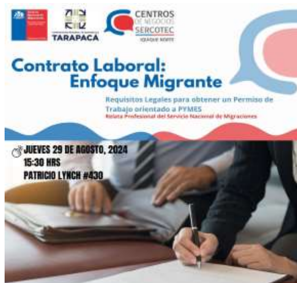
Flyer de difusión, taller de Servicio Nacional de Inmigraciones