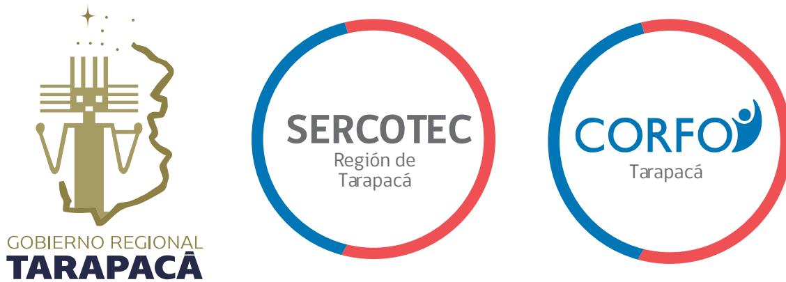
Figura nº 5 Socios Estratégicos de la CRDT, periodo Tercer Trimestre 2023.

La composición de sus Socios Estratégicos se encuentra conformada por las siguientes instituciones: