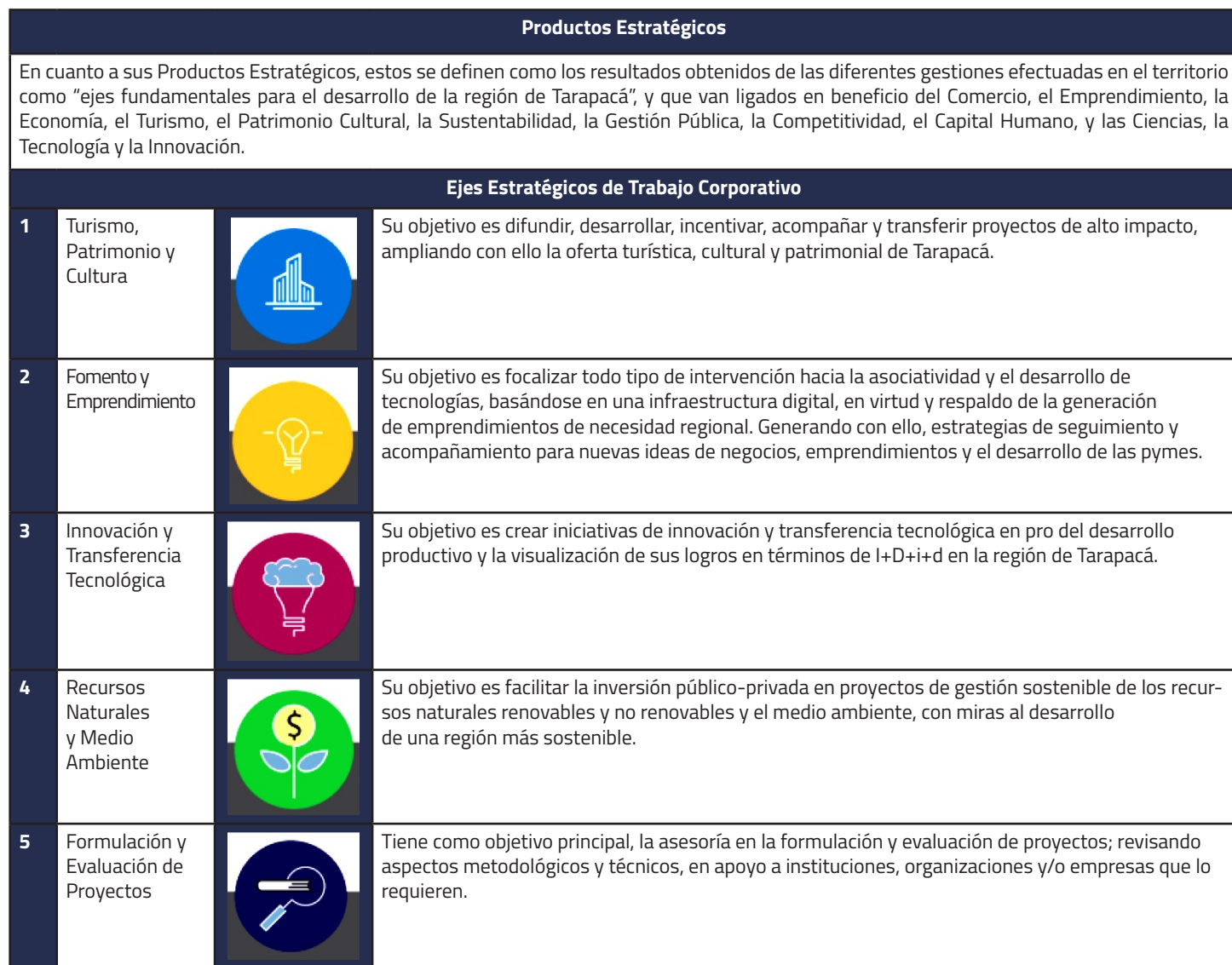
Figura n° 2: Ejes Estratégicos de la CRDT, periodo Tercer Trimestre 2023.

Respecto a su quehacer institucional, su principal función es potenciar y avanzar en temas relevantes para la región, operando a través del trabajo colaborativo con los diferentes servicios e instituciones, contribuyendo en este horizonte de gestión al diálogo, la articulación, la participación y el trabajo multisectorial, en los ámbitos público, privado, la academia y la sociedad civil; lo que se realiza a través de los siguientes productos estratégicos y líneas de acción: