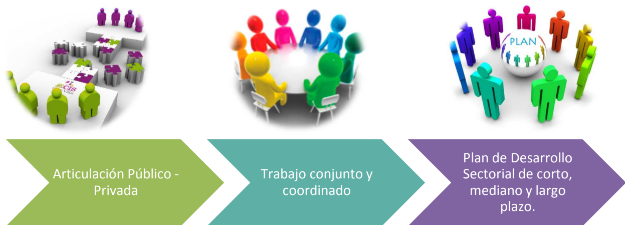
Figura N°3: Estrategia de Trabajo para las líneas de acción de los ejes estratégicos de la CRDPT.

La definición de esta estrategia, busca coordinar esfuerzos con el fin de lograr un plan de trabajo participativo, coordinando las distintas políticas institucionales y los recursos que se destinen a los distintos sectores productivos regionales, evitando la dispersión de acciones aisladas de bajo impacto, no generadoras de cambios. Conduciendo a la complementariedad y no a la competencia, de manera de lograr mayor eficiencia y eficacia de la gestión regional y de los recursos públicos y privados involucrados, donde cada organismo cumple un rol dentro del plan, con ejecución de acciones y recursos dentro de su ámbito de competencia, que sumado a los roles de los demás participantes, conducirán al cumplimiento del Plan de Desarrollo del Sector de manera integral.