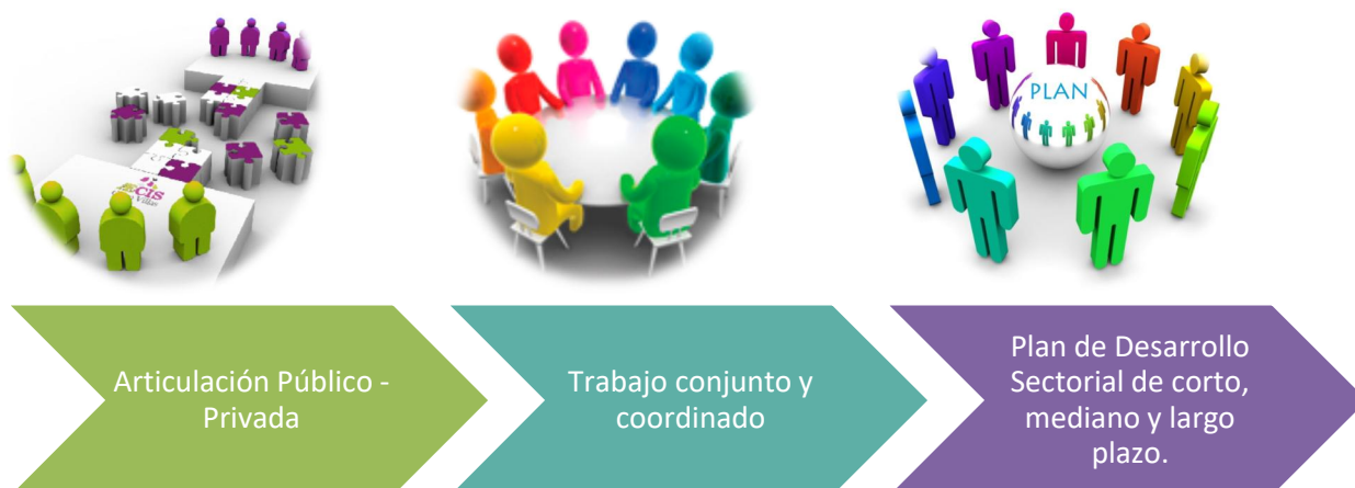
Figura N°3: Estrategia de Trabajo para las líneas de acción de los ejes estratégicos de la CRDPT.

De acuerdo a los objetivos y funciones estipuladas en los estatutos de la CRDPT, así como también la Misión, Visión, Objetivos Estratégicos y Pilares, definidos por el directorio, la estrategia genérica de trabajo se define conforme a las líneas de acción y la estrategia regional para los alcances del desarrollo productivo de la región, como se aprecia en la figura ilustrativa posterior: